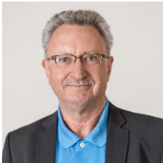
Moderator: Paul Felber