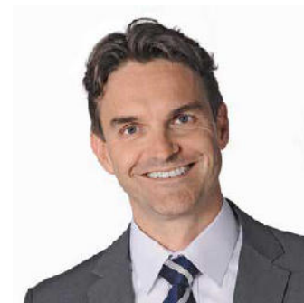
Nationalrat Dr. Beat Walti